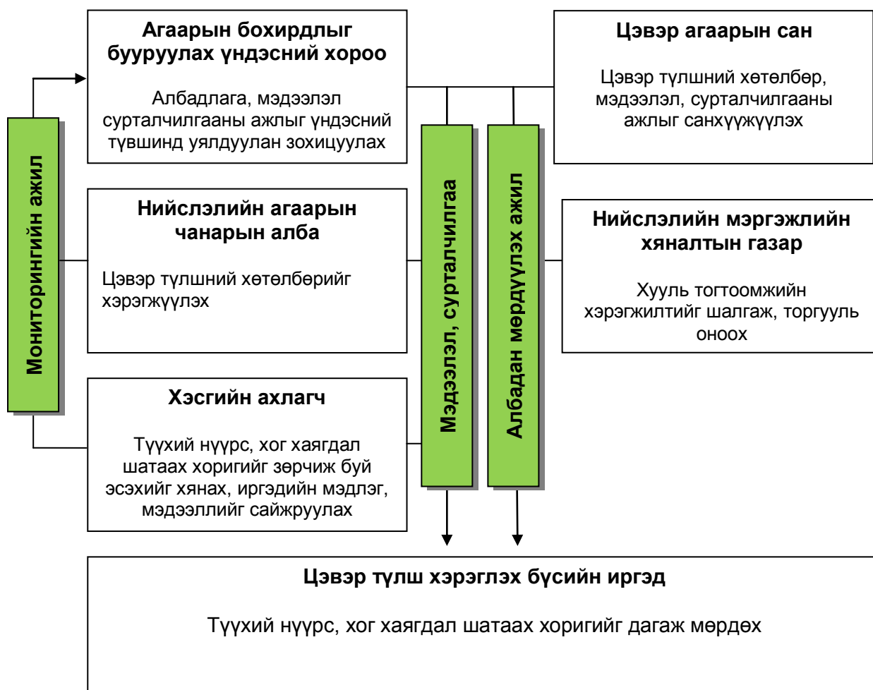
Зураг 1: Цэвэр түлш хэрэглэх үндсэн бүсэд бохирдуулагч бодис шатаах хоригийг мөрдүүлэх ажлыг хэрэгжүүлэх бүтэц

Түүхий нүүрс, хог хаягдал шатаах хоригийг мөрдүүлэх ажлыг хэрэгжүүлэхийн тулд одоо ажиллаж буй бүтэц зохион бйагуулалтыг өөрчлөх шаардлага байхгүй (Зураг 1). Агаарын бохирдлыг бууруулах үндэсний хороо улсын түвшинд энэ ажлыг уялдуулан зохицуулах үүрэгтэй. Торгуулийн орлого цуглуулах үүргийг төрийн албан хаагч бус, иргэдийн төлөөлөл болох хэсгийн ахлагчид гүйцэтгэсэнээс татварын байцаагч юмуу мэргэжлийн хяналтын байцаагч энэ ажлыг хийх нь зүйтэй. Харин хэсгийн ахлагчид нь журам дүрэм мөрдөгдөж буй эсэхэд мониторинг хийж, иргэдийн мэдээ, мэдээллийг сайжруулах үүрэгтэй байх хэрэгтэй. Төсөв нь цэвэр түлшний хөтөлбөрийн нэгдсэн төсөвт тусгагдаж, ЦАС-гаас санхүүжнэ. Стратегийг хэрэгжүүлэхийн тулд ЦАС-гаас цэвэр түлшний хөтөлбөрийн үйл ажиллагаанд оролцдог ажилтнуудын ажил үүргийн тодорхойлолтонд энэ талын үүргийг тодорхой тусгаж өгөх шаардлагатай. Албадлагын стратеги болон түүнийг хэрэгжүүлэх бүтэц зохион байгуулалтыг хөтөлбөрт оролцогч талуудад тодорхой тайлбарлан таниулах хэрэгтэй бөгөөд НАЧА-гийн нэг албан хаагч нь мэдээллээр хангах үүрэгтэй ажиллавал зохино.